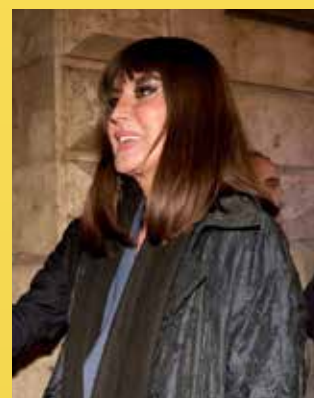
La ministra dell'Università e della Ricerca Anna Maria Bernini