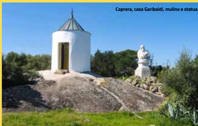
Caprera, casa Garibaldi, mulino e statua

ti di Garibaldi infatti, per alcuni giorni riuscì nell'intento di ingannare le vedette della marina tenute a vigilare. Nota a margine, il beccaccino utilizzato per la fuga in mare è conservato ancora oggi presso il Palazzo comunale di Collescipoli . Ad