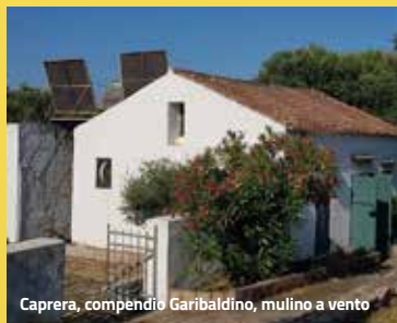
Caprera, compendio Garibaldino, mulino a vento