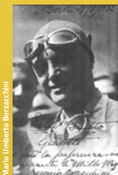
Mario Umberto Borzacchini