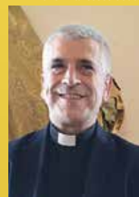
Mons. Francesco Soddu

Da Terni, ancora oggi, parte il messaggio di san Valentino: l'amore vero, fedele ed eterno è possibile anche ai nostri giorni alimentato e protetto quotidianamente dall'umiltà, dalla fede in Dio, dalla preghiera costante, dalla pazienza e dal continuo perdono.