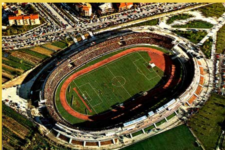
Stadio Libero Liberati, 1972-73

Amo pensare, e l'ho scritto anche nella prefazione del libro Nessuno mai, la presunzione dei fatti , che sul sellino di quella Gilera 4C con cui Libbero vinse il mondiale a Monza nel '57, insieme a lui ci fossero sogni e speranze di tanti ternani e che quella vittoria abbia, sotto certi aspetti, rappresentato il riscatto per tante sofferenze così come le vittorie delle Fere , la prima volta in serie A, il sentirsi primi tra i primi.